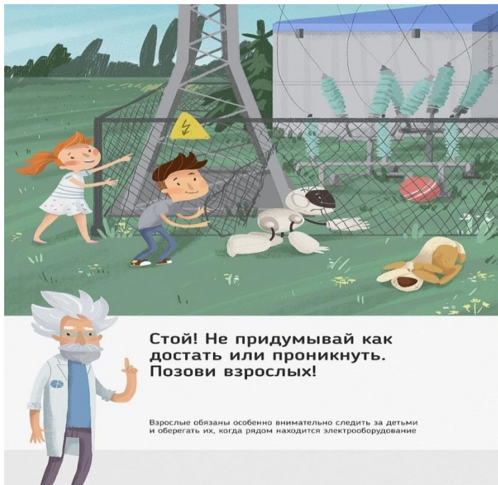
Рис. 5 Стой! Не придумывай как достать или проникнуть. Позови взрослых!