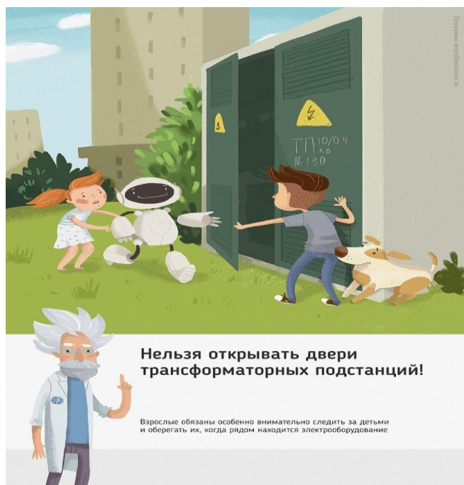
Рис.1 Нельзя открывать двери трансформаторных подстанций

Ежегодно энергетики проводят для школьников познавательные уроки, конкурсы рисунков и историй на тему электричества и правильного с ним обращения. Но работы одних энергетиков в данном направлении недостаточно, для полного понимания проблем электробезопасности нужен пример общества, в котором растет ребенок, и, конечно же, главным образом родителей. Эта работа приносит свои результаты: электротравмы на энергетических объектах единичные, и каждый случай становится поводом для служебной проверки. Но только технических мер мало для того, чтобы полностью обезопасить детей. Им нужен пример родителей.